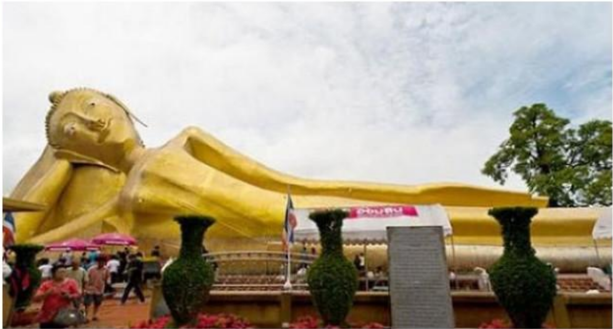
กรมศิลปเตรียมท่อมบูรณะวัดพระนอนเมืองกรุงเก่า หวังให้เป็นแหล่งท่องเที่ยวแห่งใหม่

วันพุธที่ 14 พฤศจิกายน 2555 เวลา 16:15 น.