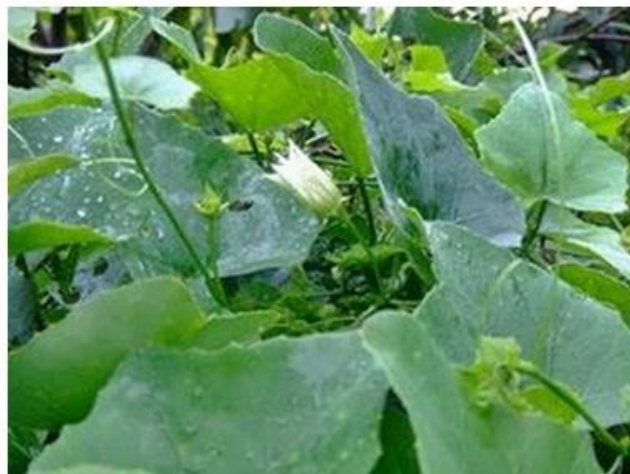
ภาพประกอบข่าวจากอินเทอร์เน็ต

วันนี้ (14 พ.ย.) ที่เรือนไทย กระทรวงสาธารณสุข นพ.สมชัย นิจนานิช อธิบดีกรมพัฒนาการแพทย์แผนไทยและการแพทย์ทางเลือก แถลงข่าวสมุนไพรไทย 6 ชนิดและผักพื้นบ้านต้านโรคเบาหวาน เนื่องในวันเบาหวานโลก 14 พฤศจิกายนว่าทั่วโลกมีผู้ป่วยเบาหวานจำนวน 285 ล้านคน และคาดการณ์ว่า อีก 20 ปีข้างหน้าจะเพิ่มขึ้นเป็น 438 ล้านคน โดยผู้ป่วย 4 ใน 5 เป็นชาวเอเชีย สำหรับประเทศไทย จากข้อมูลของกระทรวงสาธารณสุข (สธ.) ในปี 2553 พบว่า มีผู้เสียชีวิตจากโรคเบาหวานทั้งหมด 6,855 คน หรือวันละ 19 คน คิดเป็นอัตราตายด้วยโรคเบาหวานเท่ากับ 10.8 ต่อแสนประชากร หากไม่มีการควบคุมจริงจัง คาดว่าจะมีอัตราการเสียชีวิตเพิ่มขึ้นเป็น 2 เท่า อีกทั้งพบผู้ป่วยที่มีภาวะแทรกซ้อน 107,225 คน คิดเป็นร้อยละ 10 แยกเป็นภาวะแทรกซ้อนทางตา ร้อยละ 38.5 ไตร้อยละ 21.5 และเท้าร้อยละ 31.6 และผู้ป่วยเบาหวานเสี่ยงต่อการเกิดโรคหัวใจหลอดเลือดและสมองสูงถึง 2-4 เท่าเมื่อเทียบกับคนปกติและมากกว่าครึ่งพบความผิดปกติของปลายประสาทและเสื่อมสมรรถภาพทางเพศ